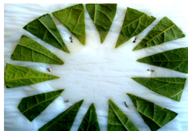
شکل ۱ - قطعات مثلثی از برگ لوبیا روی قطعه یونولیتی حامل دستمال کاغذی جهت آزمایش انتخاب آزاد (عکس از نگارنده)

داشت) جهت انجام آزمایش زیست‌سنجی دیسک برگی در گلخانه کاشته شد. سپس از هر ژنوتیپ لوبیا مورد آزمایش شش برگچه (از برگ سوم پس از جوانه‌انتهایی) جدا کرده و با استفاده از قالب مقوایی به قطر دو سانتی‌متر، شش عدد دیسک برگی (به قطر دو سانتی‌متر) از هر ژنوتیپ تهیه کرده و درپتری‌هایی به قطر نه سانتی‌متر و ارتفاع یک سانتی‌متر که با پنبه خیس مفروش شده بودند قرار داده شد. سپس روی هر دیسک برگی پنج کنه ماده بالغ بارور (۳-۵ روزه) رهاسازی شد. پتری‌ها در انکوباتور با شرایط دمایی 1 \pm 25 درجه سانتی‌گراد، رطوبت 5 \pm 55 درصد و روشنایی: تاریکی ۱۲:۱۲ قرار داده شدند (۲۲ و ۲۳). پس از ۷۲ ساعت دیسک‌های برگی از نظر میزان خسارت، تعداد تخم و تعداد کنه مرده بررسی شد. میزان خسارت وارده در این آزمایش با استفاده از روش پیشنهادی نیهول و همکاران ۱ (۱۸)، سعیدی ۲ (۲۲) و جیمنس و همکاران ۳ (۱۴) مورد بررسی قرار گرفت که در جدول (۱) شرح داده شده است.