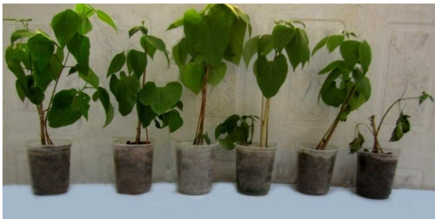
شکل ۲- تیمار گیاهان لوبیا با قارچ S. sclerotiorum و باکتری‌های جنس Streptomyces (کلدان اول تا چهارم)، شاهد سالم و شاهد بیمار (از چپ به راست)

(شکل ۳). سنجش فعالیت آنتاگونیستی این هشت جدایه در سطح آزمایشگاه آشکار کرد که این جدایه‌ها توانستند از رشد میسلیمی S. sclerotiorum به طور قابل توجهی جلوگیری کنند و دامنه کنترلی بین ۸۸/۵۶-۴۵/۶۰ درصد ارائه دادند. وجود هاله شفاف در آزمون‌های کشت متقابل متقابل جدایه‌های آنتاگونیست و بیمارگرها