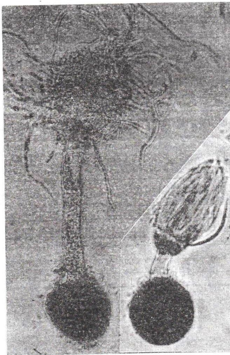
شکل ۱ - تلیوسپوره‌های جوانه‌زده Tilletia indica ، همراه با تعداد فراوان

اسپوریدیومهای اولیه قارچ از هرکدام از تلیوسپوره‌های جوانه‌زده (شکل ۱)، در ۰/۵ میلی‌لیتر آب مقطر استریل جمع‌آوری و روی سطح آب - آگار در تشتک پتری پخش شد و به مدت ۳ روز در ۲۰ درجه سانتیگراد نگهداری شدند.