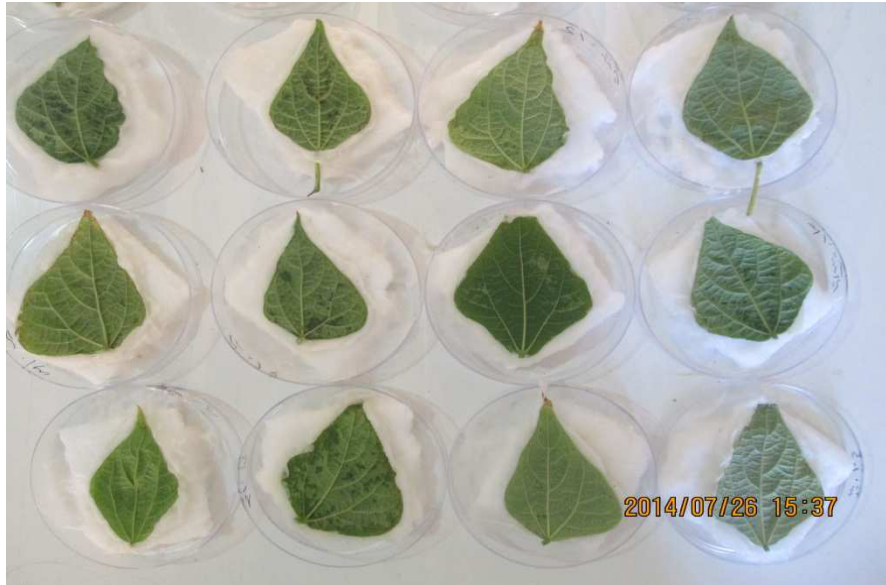
شکل ۱- برگ‌های لوبیا چشم بلبلی رقم طارم مورد استفاده در آزمایش دورکنندگی Figure 1. Leaf of black eye pea bean var. Tarom applied in this study

افزایش زمان در معرض بودن میزان تلفات در تیمارهای سیرینول و تنداکسیر افزایش یافت، به طوری که در تمامی تیمارها مقدار LC 50 پس از ۴۸ ساعت کمتر از میزان متناظر آن پس از ۲۴ ساعت بوده است (جدول ۱).