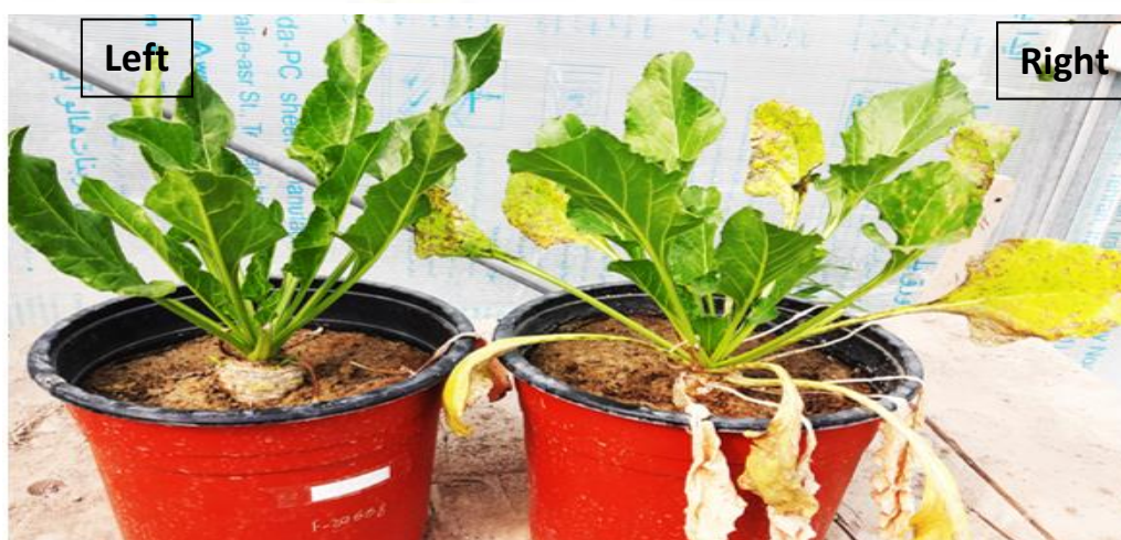
شکل ۲- مقایسه درصد آلودگی رقم حساس HI 0063 (a و راست) و مقاوم Merak (b و چپ) چغندر قند نسبت به بیماری لکه برگی سرکوسپورایی

Figure 2- Comparison of the percentage of contamination in sensitive HI 0063 (a and Right) and Resistant Merak (b and Left) sugar beet Cercospora leaf spot disease